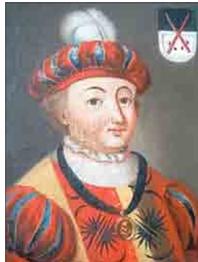
Ernst (1441 - 1486) Kurfürst von Sachsen, Landgraf in Thüringen, Markgraf zu Meißen - Stammvater der ernestinischen Linie des Hauses Wettin, die bis 1918 die Ernestinischen Herzogtümer regierte Gemälde im Residenzschloss Altenburg, Schloss- und Spielkartenmuseum

schaft Brandenburg übertragen und so den Aufstieg der Hohenzollern eingeleitet. Fortan gehörte das Oberhaupt der Wettiner zum siebenköpfigen Gremium der Kurfürsten, die den König, künftigen Kaiser des Heiligen Römischen Reiches Deutscher Nation wählten. Jüngere Mitglieder des Hauses führten den Titel eines Herzogs von Sachsen (das tun sie bis heute).