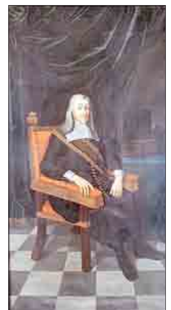
Ernst I. (der Fromme; 1601 - 1675) Herzog von Sachsen-Gotha, Vater von Bernhard I. von Sachsen-Meiningen; Gemälde postum von Samuel Diez, um 1845

Seine Nachkommen führten fortan wieder den Titel „Herzöge von Sachsen“. In den folgenden Generationen wurden alle Söhne an der Herrschaft beteiligt; dabei spielten auch theologische (aus der Reformation hergeleitete) Motive eine Rolle. Das führte zu einer erheblichen Zersplitterung der Herrschaft, einhergehend mit einer Minderung des politischen Einflusses im Reich.