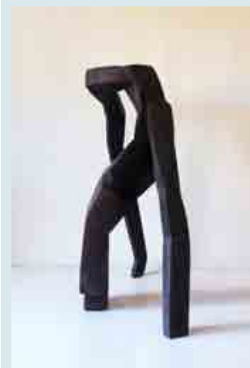
Sich halten - Holz-Skulptur von Beate Debus aus Oberalba/Rhön