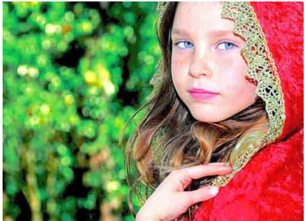
Das Gesicht des Thüringer Märchen- und Sagenfestes in Meiningen: Rotkäppchen