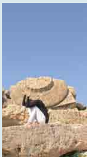
Fine Gräfenhorst aus Norddeutschland während einer Tanz-Performance