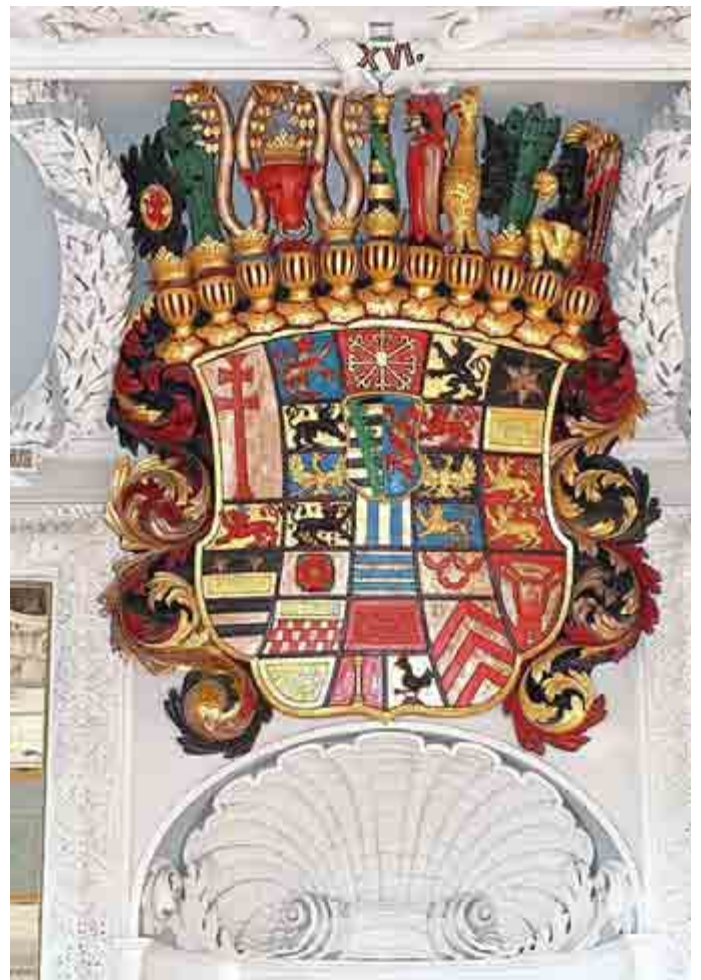
Ernestinisches Wappen der Herzöge von Sachsen-Meiningen im Hessensaal des Schloss Elisabethenburg