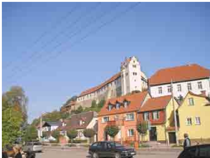
Burg Wettin in der Nähe von Wittenberg und Eisleben, Stammsitz der sächsischen Fürsten, der Wettiner

Einen vergleichbaren Prozess haben auch die Familien der Könige, Großherzöge und Herzöge von Sachsen durchlaufen. Sie sind „Wettiner“, da ihr gemeinsamer Stammvater, ein Graf, sich nach der Burg Wettin nördlich Halle an der Saale (also im heutigen Sachsen-Anhalt) nannte. Seine Nachkommen wählten ihre Namen, wie damals üblich, nach ihren wichtigsten Burgen (u.a. Brehna, Camburg, Eilenburg, Groitzsch); Namenswechsel kamen dabei häufig vor.