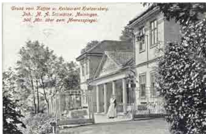
Gaststätte Kratzersberg, Postkarte von 1927