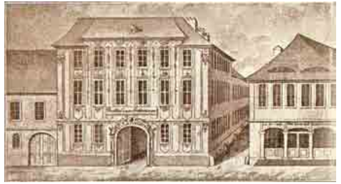
Das alte Hotel „Zum Erbprinzen“ vor 1874

Fotokopie nach Goecking-Farnbach: St. Johannis-Loge Charlotte zu den drei Nelken im Orient Meiningen. Meiningen 1924, S. 32