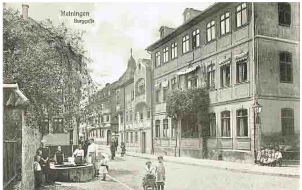
Burggasse mit dem sogenannten Erfaschen Haus, rechts, um 1900

Der Redaktionsschluss für diese Ausgabe ist der 12.05.2017, 12.00 Uhr.