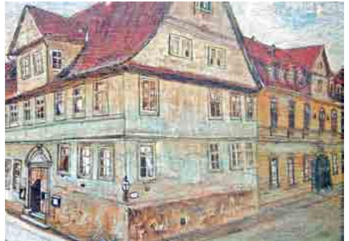
Klostersgasse, Ecke Untere Marktasse, Heimsches Haus und Keyßnersche Hofbuchdruckerei (rechts)

Das vermietete Haus gegenüber der heutigen Volkshochschule verkauften sie vor 1830. Dieses Gebäude ist aber auch in einer anderen Hinsicht interessant. Denn seit 1832 befand sich darin auch die Keyßnersche Hofbuchdruckerei, in der die Freimaurer die meisten ihrer Schriften drucken ließen. Dieses Druckhaus existiert bereits seit 1675 unter verschiedenen Namen zunächst in der Freitagsgasse und heute in der Klostersgasse 2 als Druckhaus Resch.