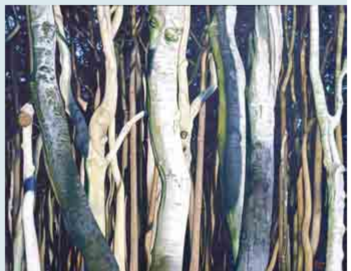
Uwe Pfeifer: Waldinneres, 2013, Öl auf Leinwand – eine von mehreren Naturdarstellungen in der Ausstellung