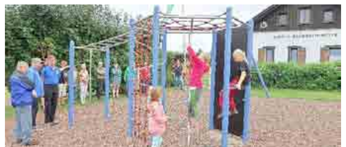
Auch am neugestalteten Hüttenspielplatz sind noch Erweiterungen vorgesehen

Kontakt: Benno Fernkorn, 03693 / 89 22 583