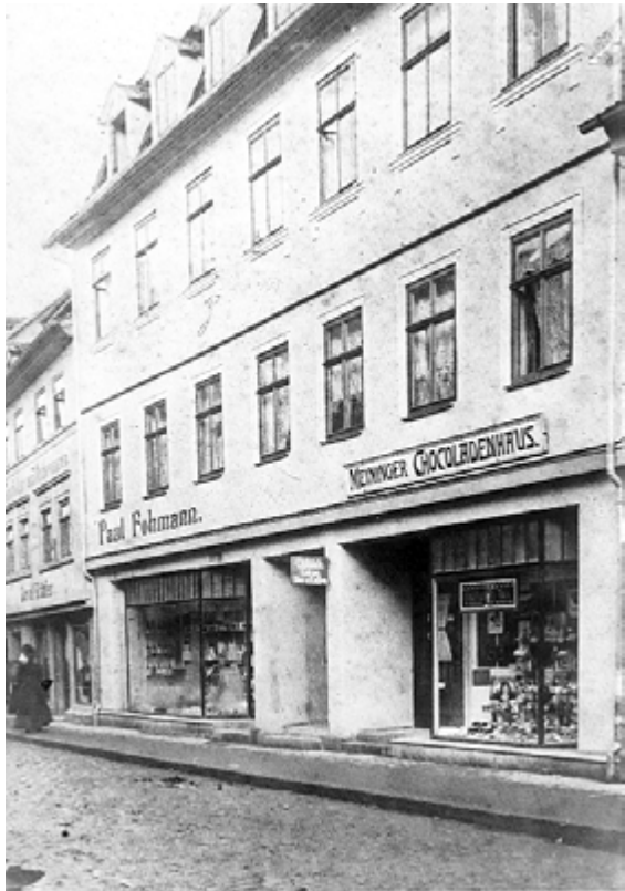
Wohnhaus Anton-Ulrich-Straße 29 um 1900

1844 gelang es ihnen, sich wieder im ehemaligen von Eybenschen Palais einzumieten. Den Tempel gestalteten sie zu einer romanischen Säulenhalle mit blauem Himmel ringsum um, wobei die Säulen im Osten denen im Dom von Würzburg nachempfunden worden waren. Nachdem aber der Hausbesitzer die Miete erheblich erhöht hatte, verließen die Freimaurer das Palais endgültig und kauften 1873 ein anderes Gebäude am Steinweg. Das bisherige, auch als Hotel „Zum Erbprinzen“ genutzte Logenhaus fiel ein Jahr später dem großen Meiningener Stadtbrand zum Opfer. Auf dem Grundstück gegenüber der heutigen Stadtapotheke allerdings wurde kurze Zeit später erneut ein Hotel mit dem gleichen Namen errichtet.