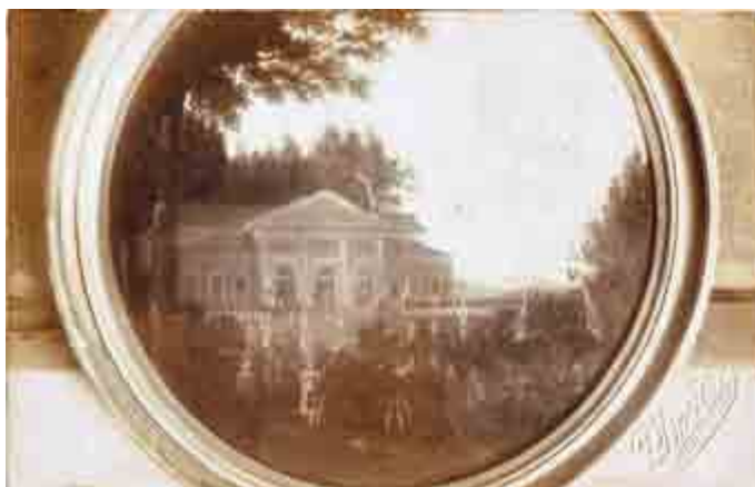
Altes Schießhaus in Meiningen, Zeichnung um 1840 Sammlung Meininger Museen