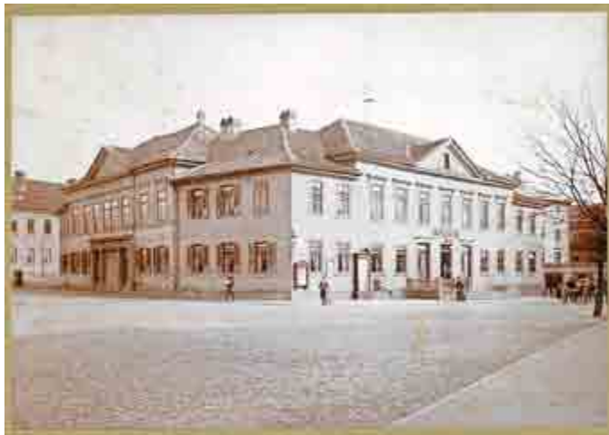
Hotel „Sächsischer Hof“, Fotografie nach 1850

Über Jahrhunderte hinweg ist der sogenannte Sächser eng mit der Geschichte der hiesigen Logen verknüpft. Das Gebäude an sich war in den letzten Jahren des 18. Jahrhunderts wohl als eine Art Gesellschaftshaus errichtet, dann aber mit Mitteln der Herzoglichen Kammer zum Logierhaus für hochrangige Gäste umgebaut worden. Seit 1802 fungiert er nun als Gasthof. Als das erste Haus am Platze kann er inzwischen auch als ältestes, noch betriebenes Gasthaus angesehen werden. In diesem Haus fanden Konzerte, Bälle, auch Konferenzen der Bahn- und Aktiengesellschaften statt. Hier trafen sich zeitweilig die Mitglieder der Casinogesellschaft. 75 Jahre lang war es Postgebäude. Und immer wieder fanden und finden hier Veranstaltungen der Freimaurer statt. Vor allem während des zweiten Viertels des 19. Jahrhunderts, als die Logenbrüder kein eigenes Haus besaßen und ihr bisheriger Mietvertrag gekündigt worden war, kamen sie häufig hier, aber auch im Schießhaus (heute Schützenhaus und Volkshaus) unter.