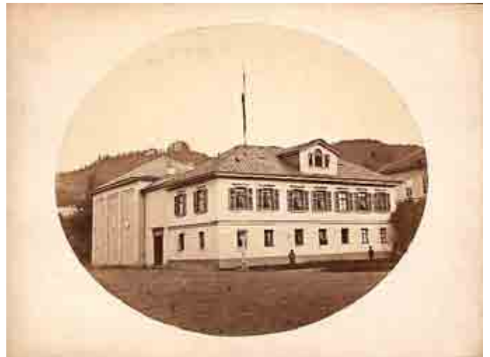
Das alte Logenhaus mit dem Anbau des Tempels am Steinweg, um 1900;

Der Kauf des sogenannten Alten Logenhauses an der Ecke der heutigen Neu-Ulmer-Straße zum Steinweg erfolgte 1873. Nach dem Anbau des Saales für den Tempel fand die Einweihung am Vorabend des 100-jährigen Stiftungsfestes 1874 statt. Da sich jedoch nur wenige Tage später der große Stadtbrand ereignete, der 2/5 der Meiningener Altstadt zerstörte, wurde das Logenhaus kurze Zeit darauf wieder umfunktionierte, um einigen Brüdern ihren Familien, die ihre Wohnungen verloren hatten, für einige Zeit Obdach zu bieten. Relativ bald zeigte es sich, dass der Logenbetrieb an diesem im Hinblick zur Werra relativ tiefen Standort durch Hochwasser zeitweise beeinträchtigt wurde. Außerdem erschien das Haus damaligen Freimaurern nicht repräsentativ genug, daher wurde schon bald über einen Neubau nachgedacht. Nach dem Auszug der Freimaurer erfuhr das Haus verschiedene Nutzungen. Zeitweise soll sich im Saal ein Kino befunden haben und die Herremhemdenfabrik „Welt-on“ gebrauchte das Anwesen in der zweiten Hälfte des 20. Jahrhunderts als Näherei und Lager. Nach der Wende stand es leer und verfiel und wurde daher nach 2000 abgerissen.