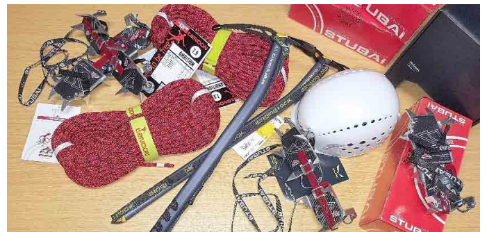
Die neue Hochtourenausrüstung - Top-Marken, sehr leicht, beste Qualität

Über eine neue Hochtourenausrüstung kann sich die Sektion Meiningen des Deutschen Alpenvereins (DAV) freuen. Sie besteht aus zweimal 50 Meter Sicherungsseilen, vier Paar Leichtsteigeisen sowie je vier Eispickeln und Steinschlaghelmen. Die Ausrüstung wird den Vereinsmitgliedern künftig für Touren durch die Schnee- und Eis-Region, also in der Regel solchen über 2.500 m Höhe, zur Verfügung stehen. „Wir werden den bergsportlichen Aspekt unserer Vereinstätigkeit wieder mehr in den Vordergrund stellen - und wer Lust hat, mal etwas auszuprobieren, soll das auch können, ohne sich gleich in große Kosten zu stürzen“, begründete Vereinsvorsitzender Gunter Ungerecht die Anschaffung. Die Ausrüstung wurde durch die Stadt Meiningen mit 690 Euro aus der Vereinsförderung bezuschusst. Die Gesamtkosten beliefen sich auf 1.150 Euro.