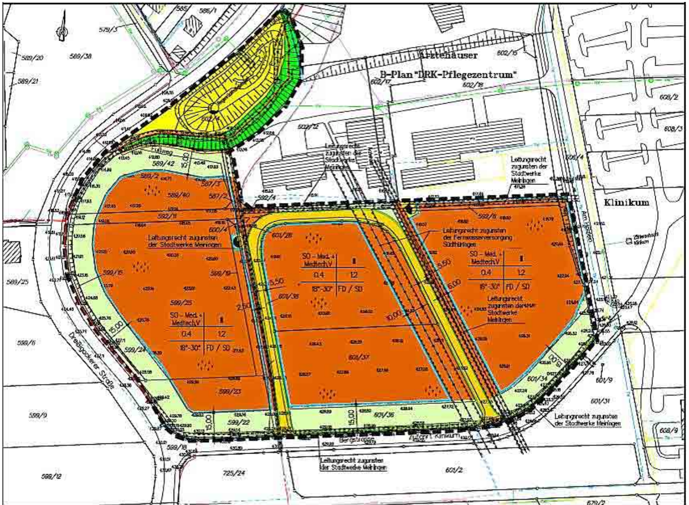
BP-Nr.: 16 a „An der Bergstraße“ OT Dreißigacker“

Der Geltungsbereich des Bebauungsplanes ist im nachstehenden Kartenausschnitt dargestellt.