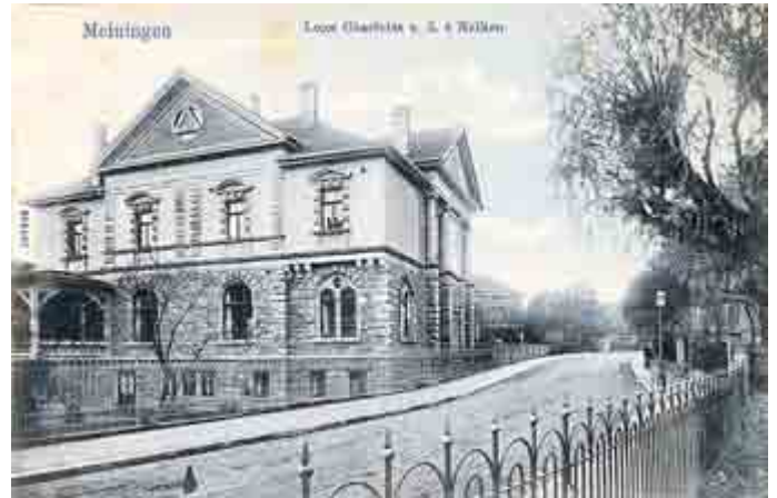
Südseite der Freimaurerloge „Charlotte zu den drei Nelken“, um 1910; Fotografie, Meininger Museen

Jedoch waren Freimaurer schlecht kontrollierbar und den Nazis ein Dorn im Auge. Gleich bei Machtantritt der Nationalsozialisten wurde die Freimaurerei verboten und Sommer 1935 das Logenhaus samt -vermögen beschlagnahmt. Das Gebäude wurde durch die Kreisleitung der NSDAP genutzt und anschließend, das ist eine Ironie der Geschichte, durch die Kreisleitung der SED. Durch glückliche Umstände sind wir aber in der Lage, Aussagen über die ursprüngliche Raumaufteilung und Aussehen der Logenräume machen zu können. Daher bietet die Ausstellung in den Meininger Museen (Di-So 10-18 Uhr) noch bis zum 1. Mai 2017 Gelegenheit, hinter die damals meist verschlossenen Türen der Meininger Loge „Charlotte zu den drei Nelken“ zu schauen. Außerdem haben die Brüder der heutigen Loge im zweiten Abschnitt der Ausstellung einen Tempel live aufgebaut. Darüber hinaus kann man sich im dritten Abschnitt in der Unteren Galerie des Schlosses über Anliegen und Geschichte der deutschen und europäischen Freimaurerei informieren.