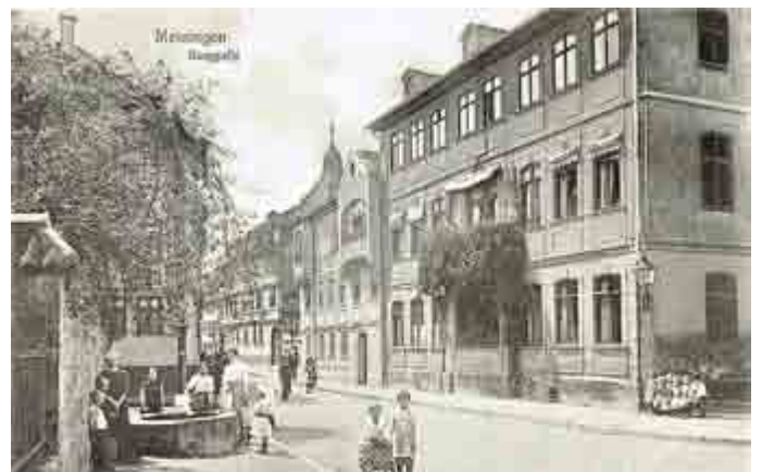
Burggasse mit dem sogenannten Erffaschen Haus, rechts, um 1900