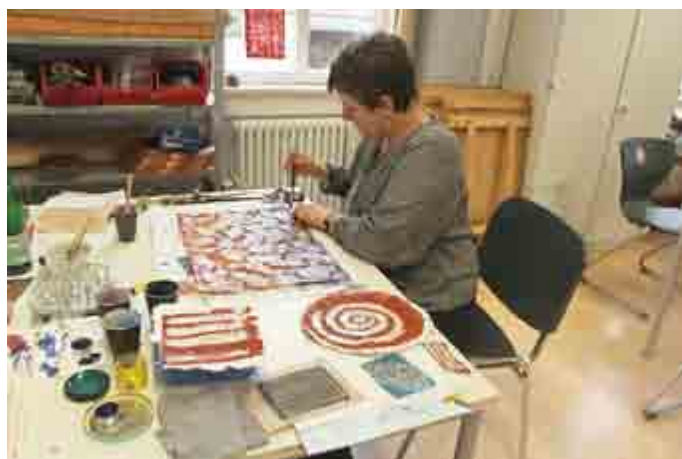
Papierbatik; Foto: Bianca Menger

Der Kurs findet im Kinder- und Jugendzentrum „Max' Inn“ - Marienstr. 6 - statt.