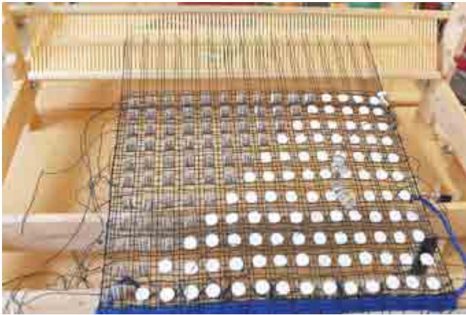
Weben an der Christophine Kunstschule; Foto: Bianca Menger