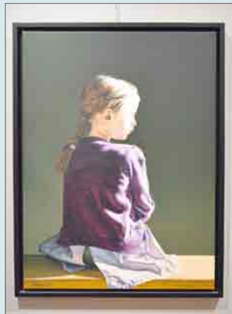
Uwe Pfeifer: Amelie, 2012 Öl auf Leinwand - eines der zahlreichen Porträts in der Ausstellung