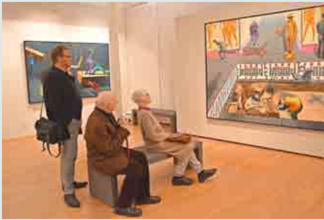
Blick in die Ausstellung mit Besuchern vor den meist großformatigen Gemälden von Uwe Pfeifer aus Halle