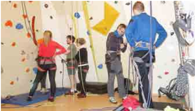
Klettern im Kirchturm