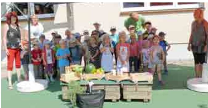
Die Kinder hatten für ihre Gäste neben Zucchini-Schnecken, Käsespießen und Traubengrütze mit Naturjoghurt auch ein Programm mit Liedern vorbereitet.