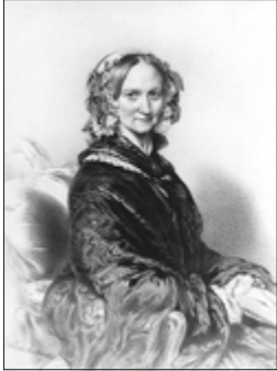
Königin Witwe Adelheid: Porträt von Franz Xaver Winterhalter um 1845

Mittels einiger Zahlenspielerereien soll im Folgenden der Versuch unternommen werden, zumindest eine gewisse Teilbilanz über „Ausgaben“ und „Einnahmen“ in diesem „Geschäft“ der besonderen Art zu ziehen.