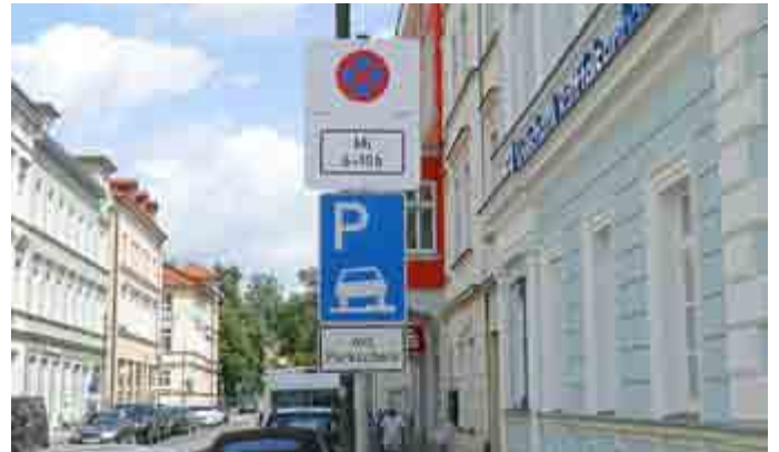
Mit Klappschildern wird das temporäre Haltverbot zur Durchführung der Straßenreinigung ausgewiesen. Werden Fahrzeuge verbotswidrig abgestellt, wird in der Regel ein Verwarnungsgeld erhoben. Wiederrechtlich abgestellte Fahrzeuge können aber auch kostenpflichtig abgeschleppt werden.

Im August ist der Startschuss für regelmäßige Kehrwochen in der Innenstadt gefallen. Klappschilder informieren rechtzeitig, wann die Kehrmaschine kommt.