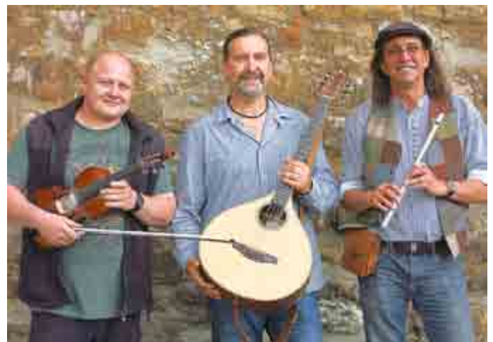
An Beal Bocht