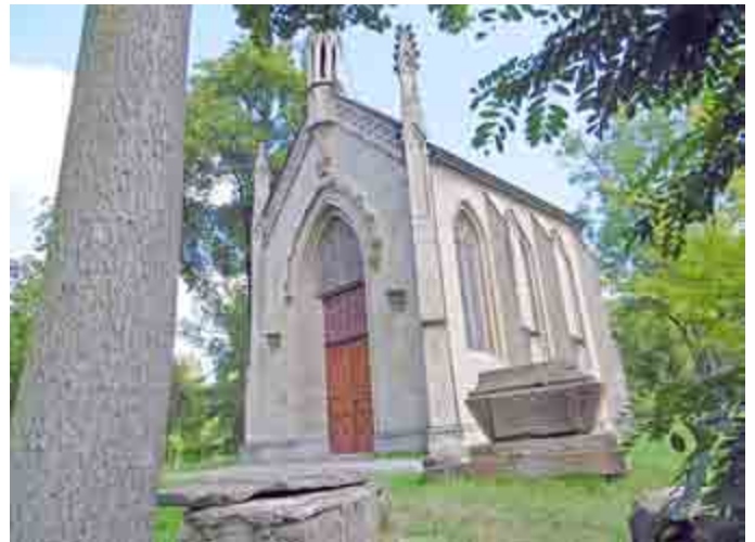
Englischer Garten Gruftkapelle: Die Herzogliche Gruftkapelle im Englischen Garten wurde 1839 eingeweiht. Sie war zunächst die Grablege für die Eltern und die Großmutter von Adelheid.

zeigte sich wenig bereit, eigenes Geld in diese Grabstätte zu investieren. Somit blieb es Adelheid vorbehalten, mit der Zurverfügungstellung von etwa 10.000 Gulden über die Hälfte der angefallenen Baukosten zu bestreiten.