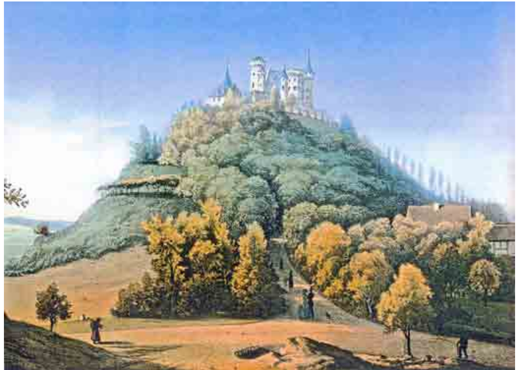
Schloss Landsberg wenige Jahre nach seiner Fertigstellung, rechts sind Gebäude der Herzoglichen Meierei abgebildet. Farblithografie um 1850, Künstler unbekannt