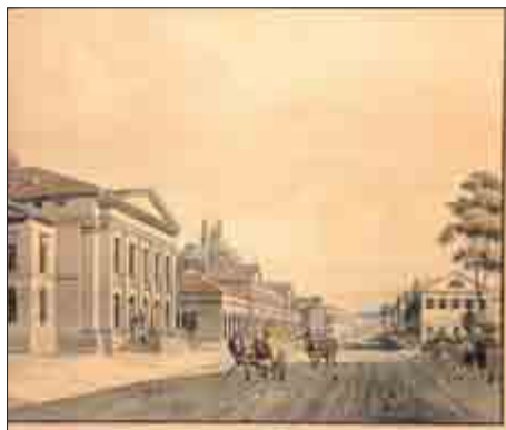
Bernhardstraße: Benannt nach Bernhard, bezahlt aber zum großen Teil von Adelheid – Gebäude in der Meininger Bernhardstraße. Grafik von Paul Schel(l)horn um 1830

Zur Errichtung des alten Theatergebäudes (1829/31) hingegen hat sie mit ca. 27.000 Gulden beigetragen. Das ist knapp ein Drittel der gesamten Baukosten gewesen. Deshalb kann man mit Fug und Recht konstatieren, dass ohne Adelheids Hilfe das bis 1908 existierende Bauwerk erst viel später zustande gekommen wäre.